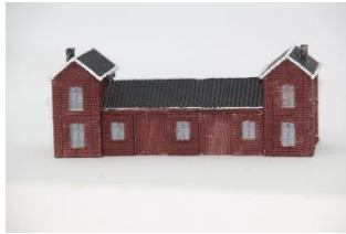
Het douane-entrepôt .