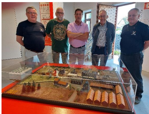
MSC Het Spoor kleurt de maquette in

Gezien de vele veranderingen met de maquette en de zonnewijzer, zullen we een opleidingsmoment inrichten op woensdagavond 8 juni om 19u30 in het KLINGSPoor. Mochten er te veel inschrijvingen zijn dan lassen we dezelfde voorlichting in op dezelfde dag in de namiddag om 14u. Gelieve aan te duiden of het namiddagmoment voor jou kan.